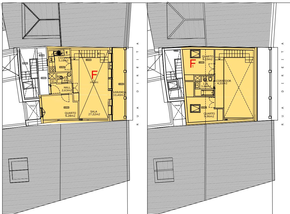
PLANTA DA FRAÇÃO